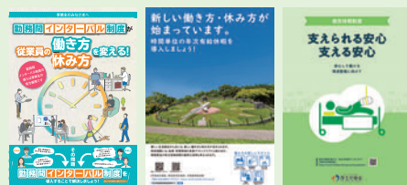
各制度に関するリーフレット(例)

「勤務間インターバル制度」「年次有給休暇の計画的付与制度」「時間単位の年次有給休暇」「特別な休暇制度」などについて、企業の取組事例の紹介や、リーフレットなどの資料を掲載しています。